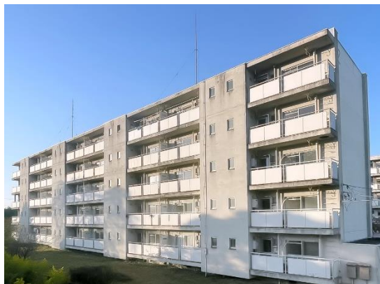
「ビレッジハウス岩瀬」外観

また、全国のビレッジハウス新規入居者を対象に、電気、ガス、インターネット回線などのライフライン契約手続き代行サービスも行っており、ライフラインの選定、および契約手続きにかかる負担を軽減することが可能となります。今後も地域での住み替え需要、法人による複数戸のまとめ借り、外国人労働者の住まい探しなどに応えるため、順次リノベーションを行います。この度の新規入居の開始によって、地域の皆様の安心な暮らしを支援するとともに、将来にわたって地域で暮らす人々の増加、地域の活性化、地域経済へ貢献してまいります。