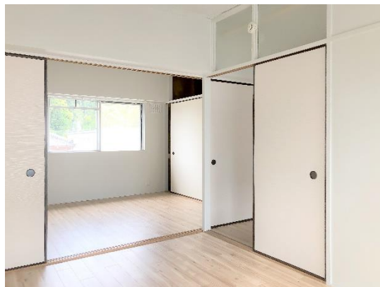
「ビレッジハウス岩瀬」内観