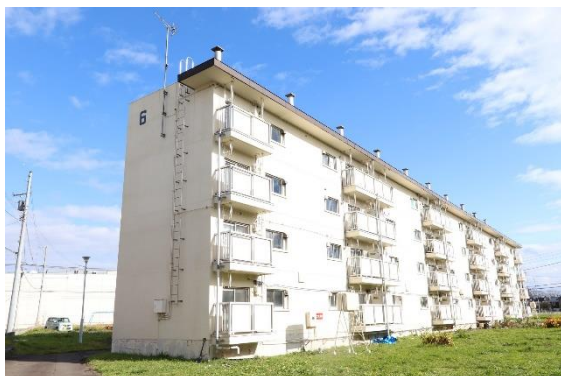
「ビレッジハウス野幌」 外観

今後も地域での住み替え需要、法人による複数戸のまとめ借り、外国人労働者の住まい探しなどに応えるため、順次リノベーションを行います。この度の新規入居者募集の開始によって、地域の皆様の安心な暮らしを支援するとともに、将来にわたって地域で暮らす人々の増加、地域の活性化、地域経済へ貢献してまいります。