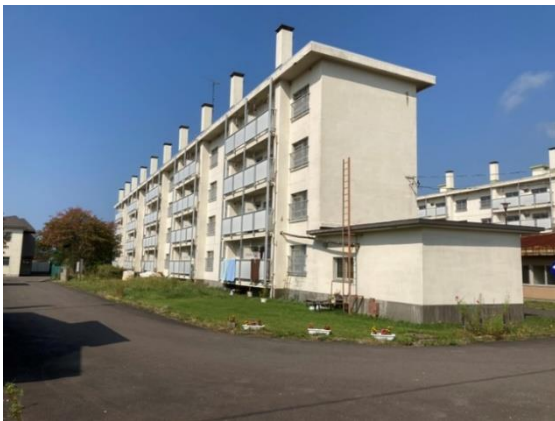
「ビレッジハウス白鳥台」外観

今後も、周辺状況や入居希望者のニーズに応じて順次リフォームを行い、さらに物件を稼働させることで地域の住み替え課題解決の一翼を担ってまいります。※2022年8月1日時点の戸数