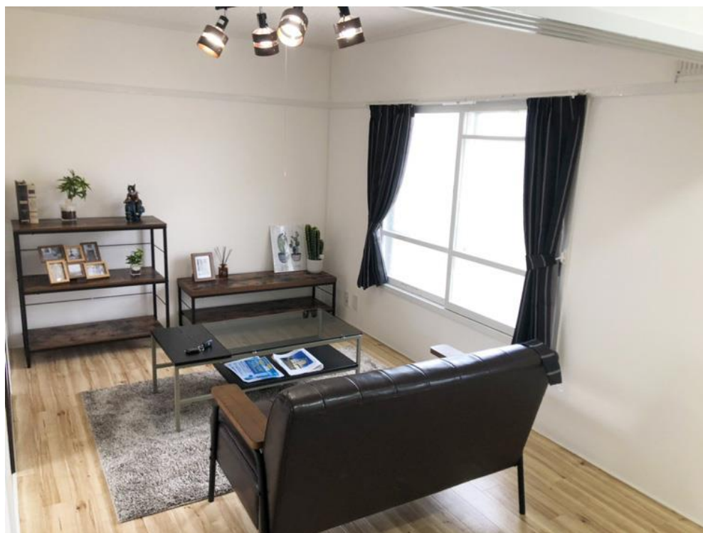
躯体を活かし、内装を一新した「ビレッジハウス白鳥台」モデルルームの一室

ビレッジハウス・マネジメント株式会社（本社：東京都港区、最高経営責任者：岩元 龍彦、以下ビレッジハウス）は、北海道室蘭市の築50年の団地をリノベーションし「ビレッジハウス白鳥台（はくちょうだい）」として再生、2022年10月15日から入居者募集を開始しました。